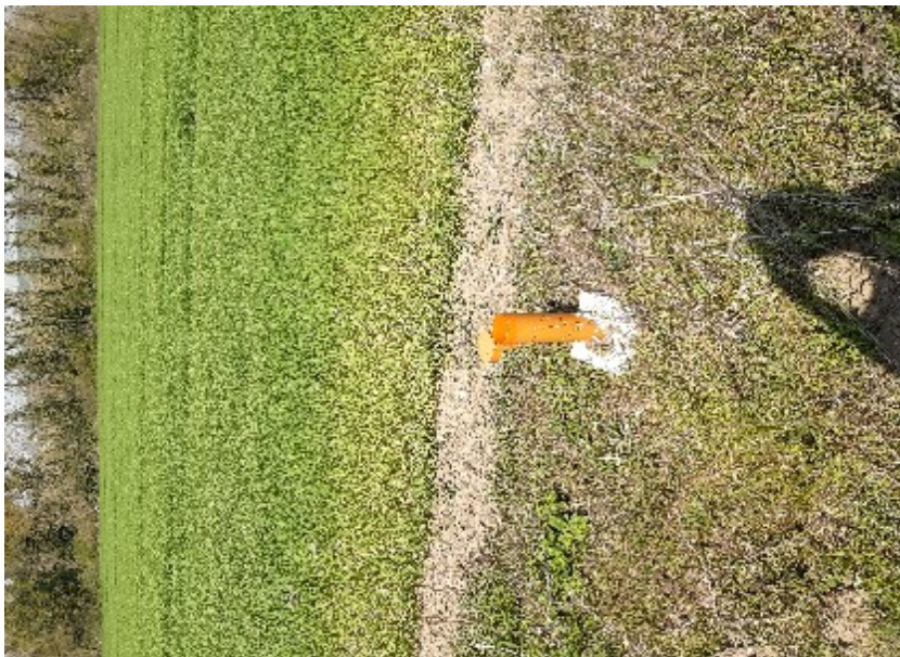
Photo du point de prélèvement